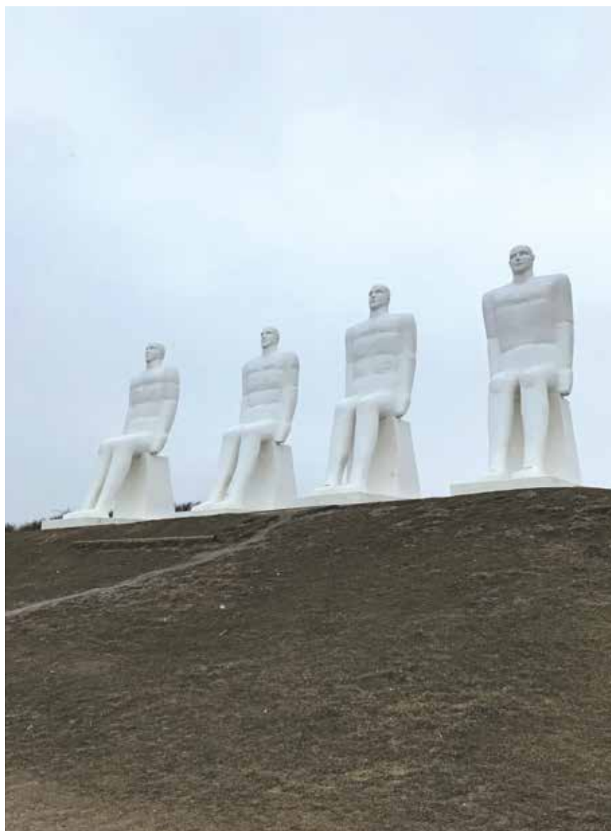
Četri cilvēki jūras krastā raugās uz horizontu, kur jūrasceļš var aizvest uz visām četrām debespusēm. Esbjerga, Dānija.