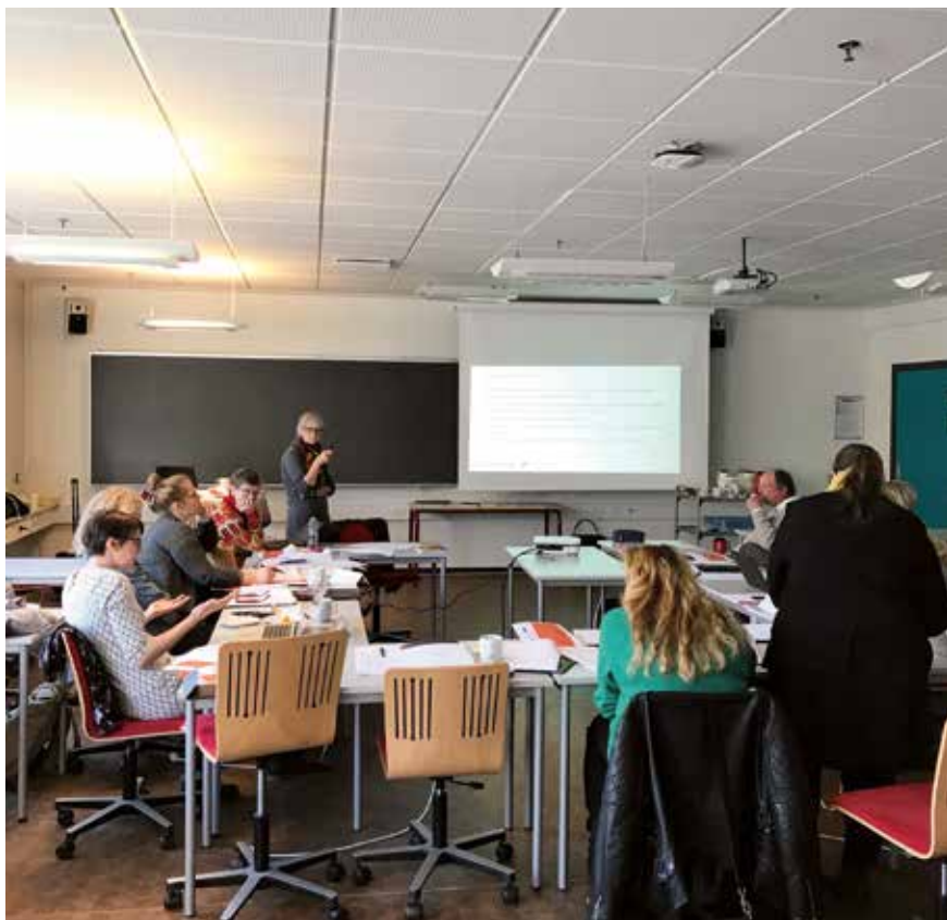
Seminārā par mācībām rīcībā 2017. gada 27. februārī Esbjergā.