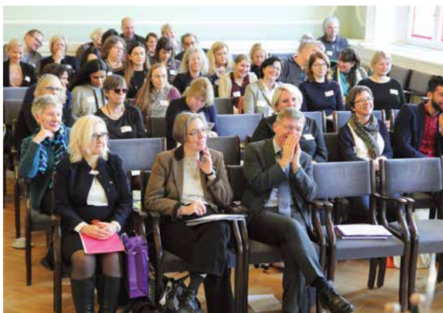
Starptautiskā projekta “Sociālā spēcīgāšana reģionos” (SEMPRE) noslēguma konferences dalībnieki 2018. gada 27. novembrī Latvijas Universitātes Mazajā aulā.