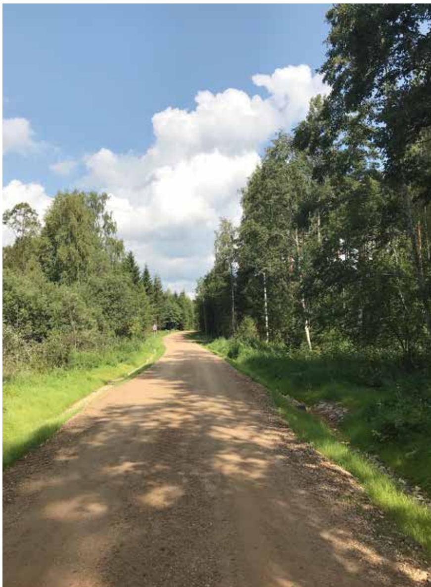
Zemesceļš Kurzemē 2018. gada vasarā.