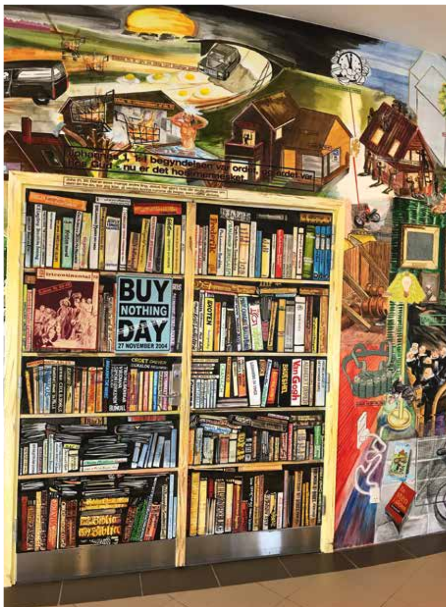
Fragments no Ērika Hagensa sienas gleznojuma “Jaunais evaņģēlijs”.