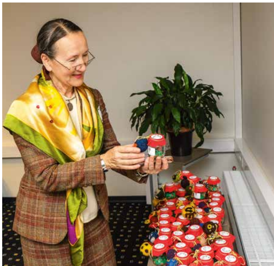
Antistresa bumbiņas no filca, domātas bērniem ar attīstības traucējumiem, papildinātas ar saritinātām citātu lapiņām no Bībeles. Izgatavotas mikroprojekta ietvaros Harkujervē ( Harkujärve ), Igaunijā.