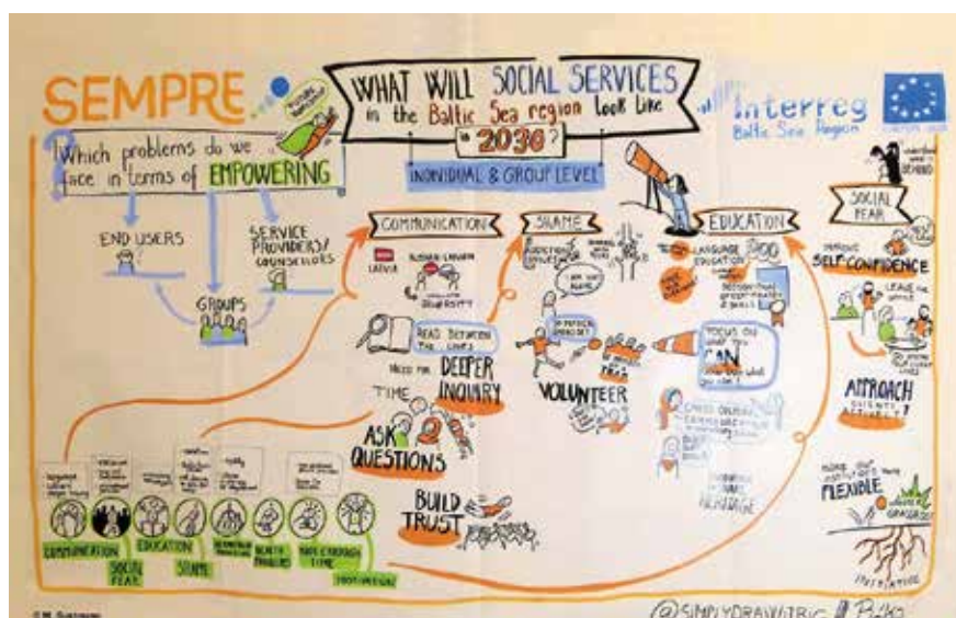
Nākotnes darbnīcas darba grupas ideju grafiskā vizualizācija noslēguma konferencē 2018. gada 27. novembrī.