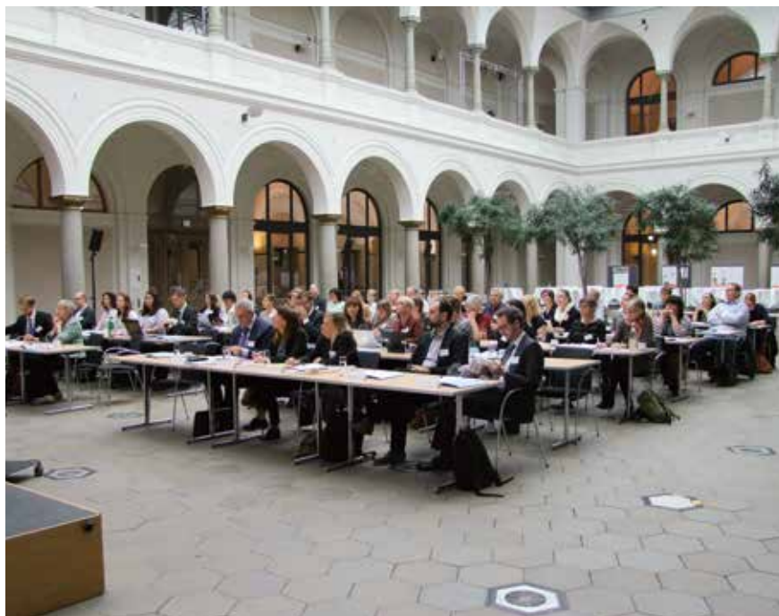
SEMPRE projekta pirmā konference 2016. gada septembrī Berlīnē.